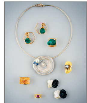
JEAN VENDÔME ENSEMBLE DE BIJOUX