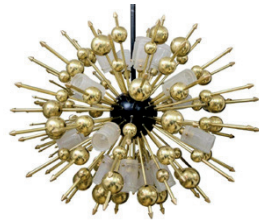
LUSTRE SPHÈRE À 18 LUMIÈRES DIAM : 90 CM