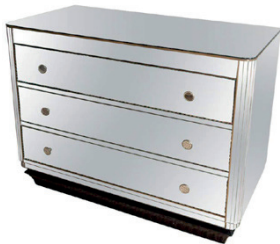
COMMODO MIROIR C. 1950 80 X 102 X 50 CM