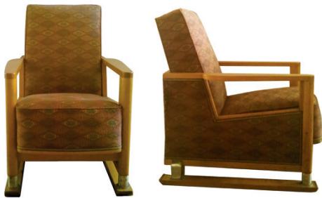
HENRI RAPIN (1873-1939) PAIRE DE FAUTEUILS SKI - C.1933

MERCREDI 30 NOVEMBRE 2016 À 14 H - DROUOT-RICHELIEU - SALLE 11 EXPOSITIONS PUBLIQUES : MARDI 29 NOVEMBRE DE 11 À 18 H ET MERCREDI 30 NOVEMBRE DE 11 À 12 H