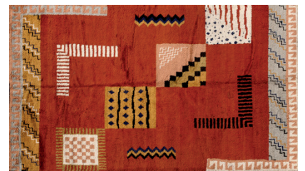
SOPHIE TAEUBER-ARP (1889-1943) TAPIS « DADA » 300 X 190 CM